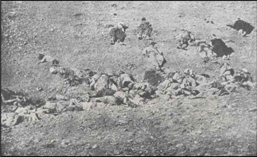
29 Ağustos 1914 tarihinde Ermeni çeteleri tarafından Siverek-Urfa Yüksek yol ve Karacadağ civarında türbe ziyareti sırasında esir edilip canlı hedef yapılarak şehit edilen müslüman Türkler. Kaynak : Ermeni Ayaklanmaları ve İhtilal Hareketleri.

Kaynak : Ermeni Ayaklanmaları ve İhtilal Hareketleri.