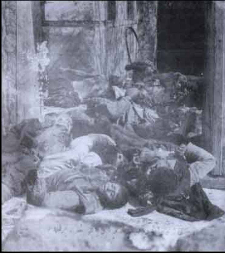
16 Şubat 1918'de, Erzincan'ın Vagarir köyünde, Ermeniler tarafından şehit edilen ve bir evin arkasında bulunan şehit edilmiş Türkler.