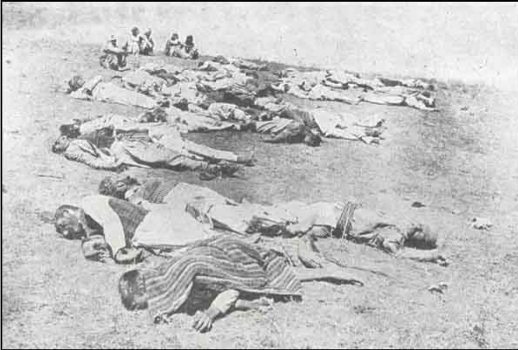
Ordudan hava değişikliği için terhis edilen ve 23 Temmuz 1915 de Diyarbakır'ın Lice kazasına bağlı Kum ve Çom köyleri civarında elleri ayakları bağlanarak Ermeni komitecileri tarafından şehid edilen askerler. Kaynak : Ermeni Ayaklanmaları ve İhtilal Hareketleri.

Kaynak : Ermeni Ayaklanmaları ve İhtilal Hareketleri.