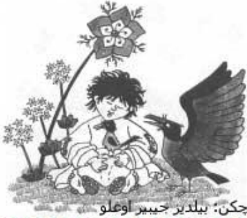
چكن: بىلدىر جىبىر اوغلو

فاتىزى يالان دونىا پاراتسىن. او ابستىردى ھىر بىر اوشاق بىر «بالاچا قارا بالىق» كىمى كىچىك گۈلمك دە ياشاماغا راضى اولمايلاق اچىق بىر دوشونچە ابلە گنىش دنىزلرىن آردىنچا پولا دوشسون. او دابانىب ايلنمەيى ھىچ سئومىردى. اونون «اولدوز» و كىچىك بىر قىز اوشاق اولدوغونا باخمايلاق قارقالار ابلە ياشاماغى، آناسى لا اۈگنى، آناسىنن يانىندا قالىب ياشاماقدان ياخشى بىلەرك، اونلارنى اىستى زىندانلارنىدان قاچاراق، آزاد بىر ياشاما سارى اوچور.