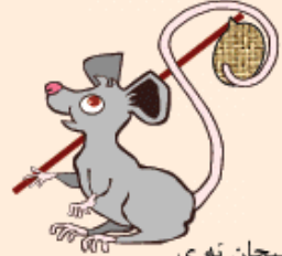
سىچان بە ي

بىرى واريدى، بىرى يوخويدى، بىر سىچان واريدى؛ قالا باغيندا؛ سو سووريردى يئل اسدى يارپاق دوشدو باشى سىندى. بئلى اتدى يتره، گلدى ائوه بوخجاسىنى باغلادى چوماغىنىن باشىنادوشدو يولا. كوچه ده بىر قايى نىن قاباغىندا قىزلار يىغىشىب گول تىكىردىلر، سىچانى گۇروب دندىلر: