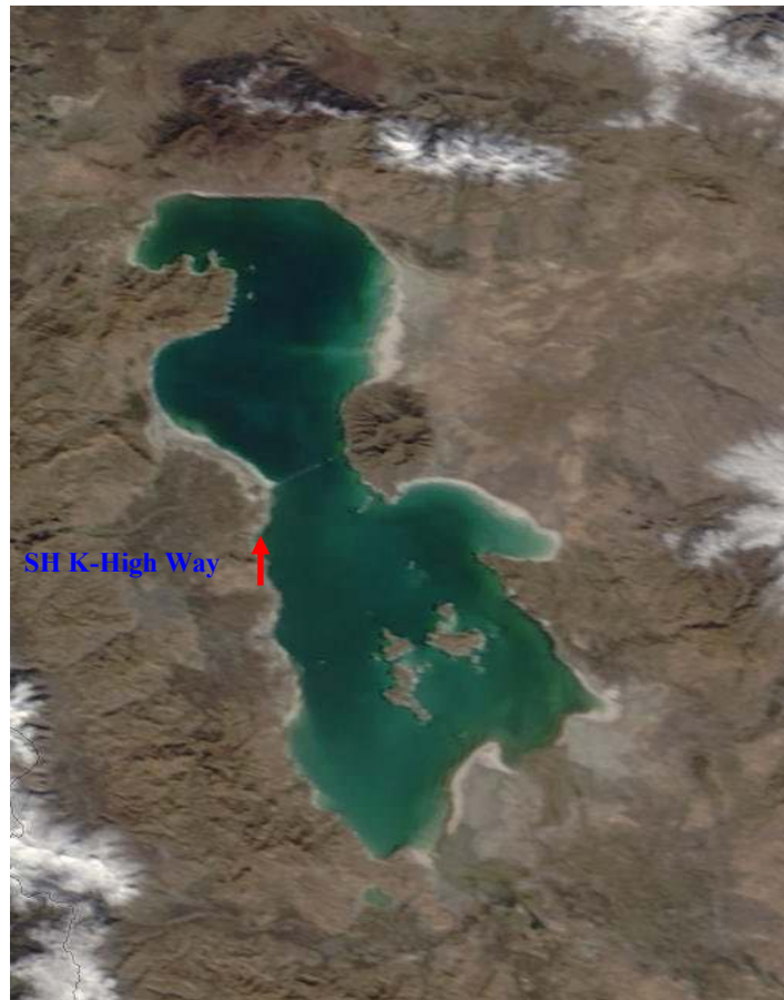
تصویر ماهواره ای از دریاچه ارومیه (تصویر ماهواره Land sat 5)

مهمترین بادهای این حوضه عبارتند از: مه یئلی یا ماراغبئلی (باد مراغه) که در تابستان از شرق به غرب می‌وزد. سلماس یئلی (باد سلماس) در تابستان از سمت شمال-شمال غرب به سمت جنوب-جنوب شرق می‌وزد. آق پئل (باد سفید) که در فصل تابستان و زمستان می‌وزد و باعث گرم شدن هوا و ذوب یخ‌ها می‌گردد، دارای جهت جنوب-شمال است. مهمترین رودخانه‌های تغذیه کننده دریاچه ارومیه عبارتند از: جیغاتی (زرینه رود)، تاتائو (سیمینه رود)، سویوق بولاق چای، گادار چای، باراندوز چای، شهر چای، نازلوچای، زولاچای، آچی چای، صوفی چای، موردو چای و لیلان چای (محمدی، 1384). بزرگراه شهید کلانتری از باریکترین عرض دریاچه (جزیره اسلامی تا کوه زنبیل) که ۱۵ کیلومتر است می‌گذرد و دریاچه را به دو بخش شمالی و جنوبی تقسیم می‌کند.