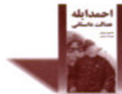
طرح روی علقه خوری تهران

«احمد ایله عدالت داستانی» «علیرضا ذیحق» مین یئنی اثری دیر کی ایلتک دفعه اولاراق خلق دیلیمنین آیدیب مکتوب لاشیب دیر.