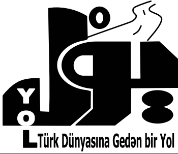
Türk Dünyasına Geden bir Yol