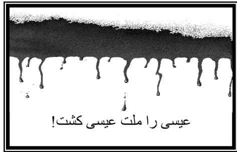
عیسی را ملت عیسی کشت!